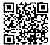
QR Code สิ่งที่ส่งมาด้วย ๑ - ๔