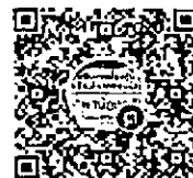
QR Code ไลน์กลุ่ม “ติดตามเด็กออกกลางคัน สนม.”